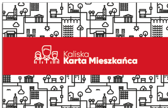
Kaliska Karta Mieszkańca – wzór

do Regulaminu Kaliskiej Karty Mieszkańca będącego załącznikiem do zarządzenia Nr 154/2024 Prezydenta Miasta Kalisza z dnia 5 marca 2024 r w sprawie ustalenia logo Programu „Kaliskiej Karty Mieszkańca” oraz Regulaminu przyznawania, wydawania i korzystania z „Kaliskiej Karty Mieszkańca”, wraz z wzorem Karty oraz wzorem wniosku o wydanie Karty.