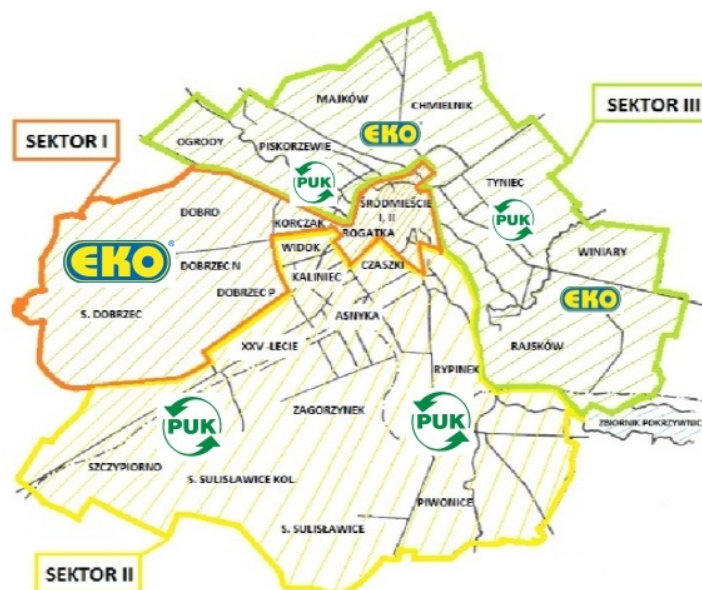
Rys. 1. Podział m. Kalisza na sektory odbioru odpadów