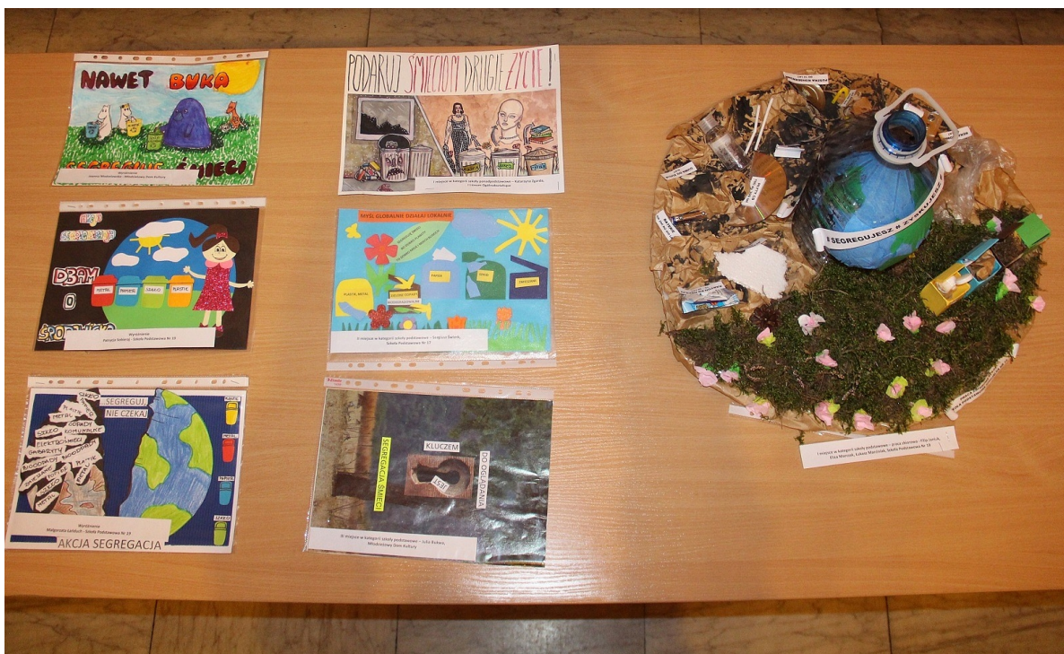
Fot. 1 Nagrodzone prace w konkursie „Akcja segregacja”